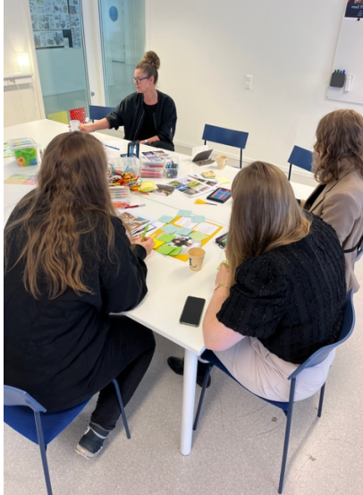
Figur 1. Visar en av workshopparna tillsammans med deltagare för att utforska vad ett smart hem kan vara.

Som en del av den prototypbaserade metodiken utvecklades även fysiska prototyper av Designgruppen/LTU, en slags "lampa" som endast kan laddas inom ramen för en lokal "energy community".