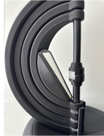
Figur 8. Visar lampans ljuskälla och reflektör och det laddningsbara batteriet.