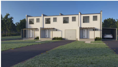
Figur 11. Inspirationsbild från projektets inledning.

bidrag sträcker sig bortom den formella projekttiden och lägga grunden för långsiktiga effekter i form av vidare utveckling, uppföljande living labs-studier och fortsatt samverkan mellan akademi och praktik.