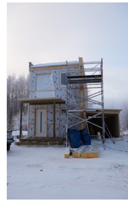
Figur 13. Bild från pågående husbyggnation (januari 2026).