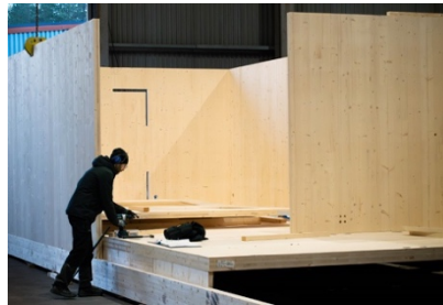
Figur 12. Bild från husmontering i fabrik.