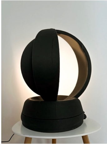
Figur 6. Visar prototypen i lysande läge med dold ljuskälla.