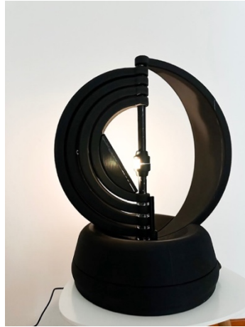
Figur 7. Visar prototypen i öppet läge.