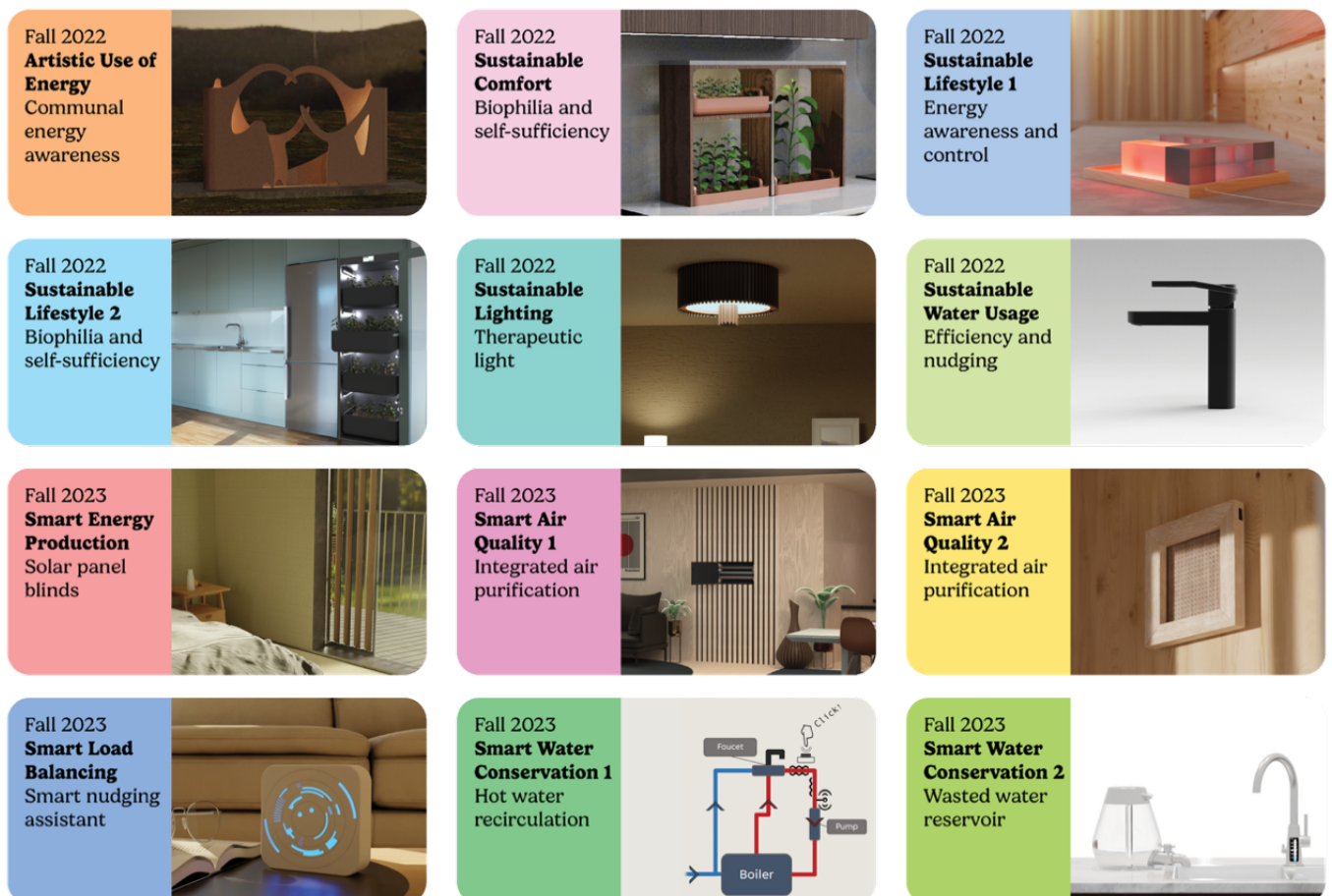
Figur 2. Utdrag av några av studentprojekten, deras fokus och koncept.

Studentprojekten har bidragit med alternativa framtidsbilder av hur boende kan organiseras och upplevas, där tekniska system integreras med sociala och rumsliga kvaliteter. Genom iterativa designprocesser med research, konceptutveckling, prototyper och reflektion har studenterna utforskat hur arkitektur och design kan stödja både individuella och kollektiva beteendeförändringar, se exempel i figur 2. Resultaten har fungerat som ett utforskande kunskapsunderlag och har visat på behovet av mer kursverksamhet och studentprojekt som omfattar hållbar vardagsenergieffektivisering.