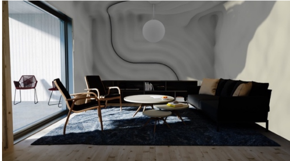
Figur 9. Explorativ rendering av huskoncept med material.